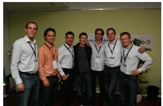
Facebook-Gründer Mark Zuckerberg besucht amiando im Münchner Büro